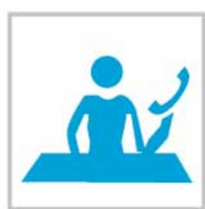
Gestión de Telefónica