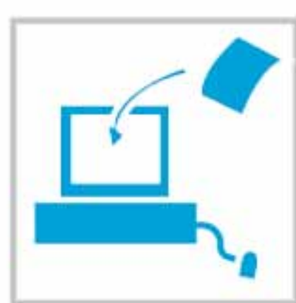
Procesamiento de datos