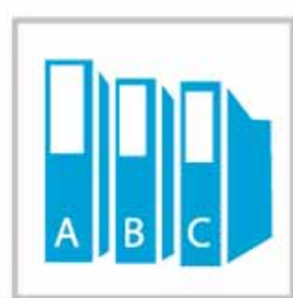
Clasificación y ordenamiento