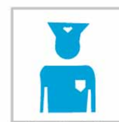
Control de Accesos