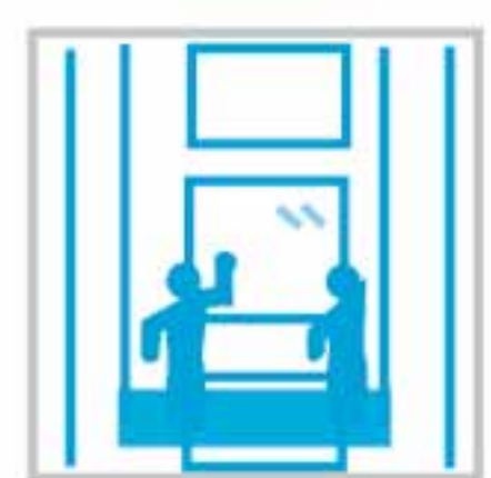
Limpieza de Cristales