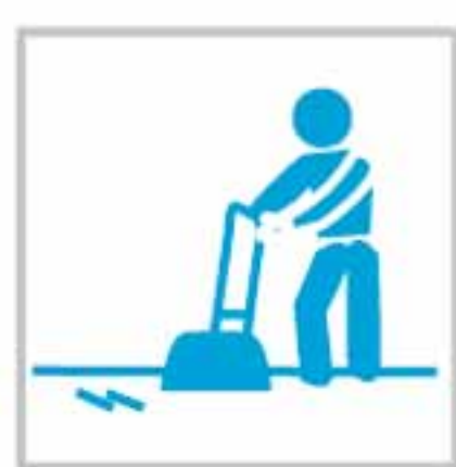
Pulidor de Suelos