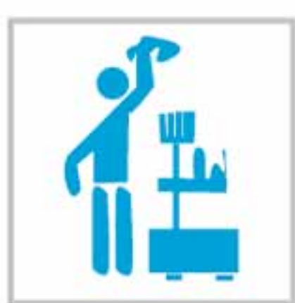
Limpieza de Choque