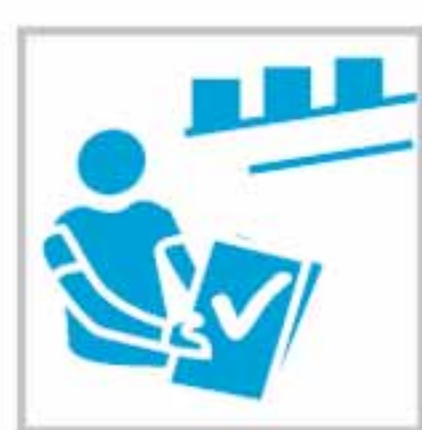
Gestión de Almacén