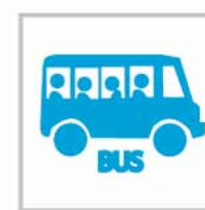
Acompañamiento Transporte Escolar